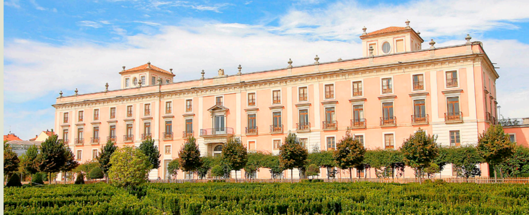
Palacio del Infante Don Luis, Boadilla del Monte, Madrid.